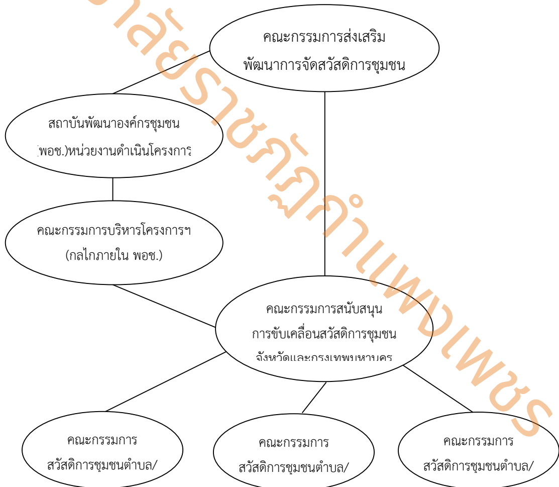
ภาพที่ 1 แสดงโครงสร้างดำเนินงานโครงการสนับสนุนการจัดสวัสดิการชุมชน

4. การช่วยเหลือสมาชิก ประเภทสวัสดิการที่จัด จำนวนเงินช่วยเหลือ เป็นไปตามกติการ่วมและฐานะการเงินของแต่ละกองทุน